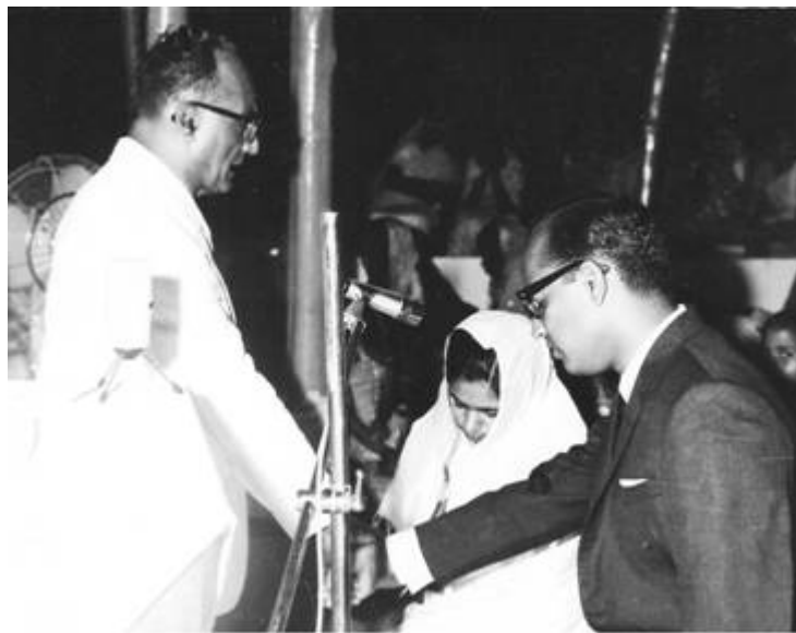
Hochzeit am 19. Juni 1968 in Vellore, geleitet von Bruder Bakht Singh

Welch ein Privileg ist es, von Gott Schritt für Schritt geleitet zu werden, so wie Er früher Seine Propheten und Heiligen geleitet hat.