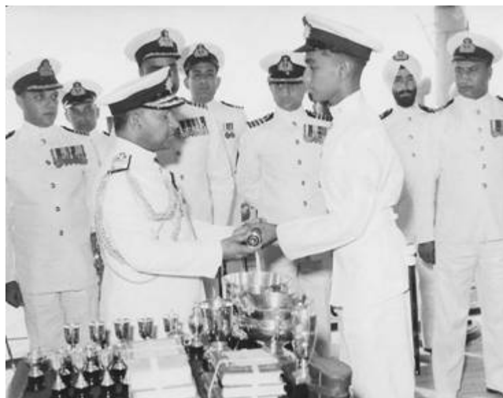
Auszeichnung als „Bester Allround-Kadett“ (Mai 1958) - Der erste Schritt zum Admiral !!