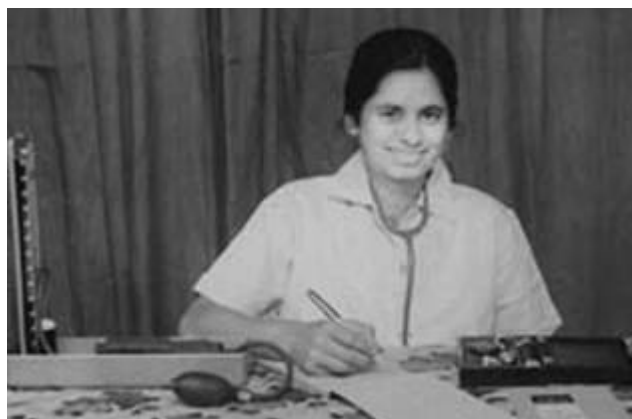
Doktor Annie – Im Dienst für die Armen