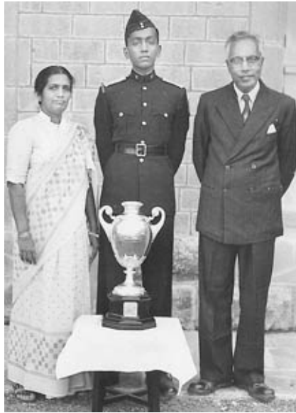
Mit meinen Eltern, als ich die „National Defence Academy“ als bester Kadett absolvierte

„glauben“. Sogar der Glaube ist eine Gabe Gottes. Daher können wir uns sogar unseres Glaubens nicht rühmen. Alles was wir tun können, besteht darin, Gott demütig zu verherrlichen.