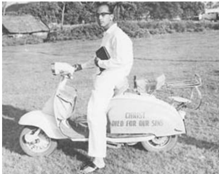
Bibelverse auf dem Motorroller – Juli 1964

Die Salbung des Geistes und die Autorität Christi sind jedes Mal, in jedem Teil der Welt, als ich aufstand, um zu predigen, meine Stärke und meine Stütze gewesen. Aber die Wirklichkeit dieser Dinge lernte ich zuerst vor mehr als 40 Jahren auf den Straßen von Ernakulam.