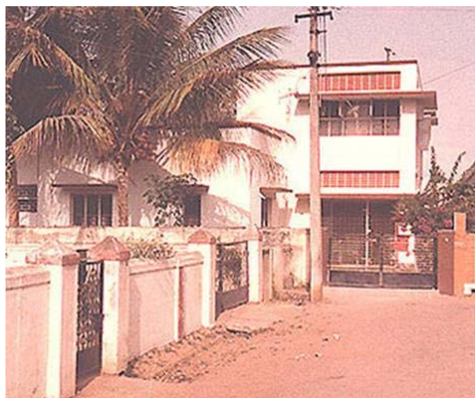
16 Da Costa Square, Bangalore, Indien - wo wir uns am 17. August 1975 erstmals als Gemeinde versammelten

Als ich all meine Ersparnisse für Gottes Werk weggab und die Marine verließ, um dem Herrn zu dienen, dachte ich nie daran, dass ich in meinem ganzen Leben jemals ein Haus besitzen würde. Aber Gott hatte Pläne, von denen ich nichts wusste. Er entfernte sogar die Regierung in Kerala, um es mir zu ermöglichen, dieses Haus in Bangalore zu kaufen. Es ist wunderbar, das perfekte Timing in allem, was Gott tut, zu sehen. Und wenn wir danach trachten, Ihn zu ehren, dann ehrt Er uns. Halleluja!