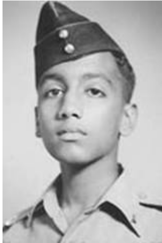
Als Kadett in der „National Defence Academy“ September 1955

Sei gegenüber der Stimme des Heiligen Geistes sensibel. Bis du vor dem Herrn stehst, wirst du nie wissen, wie viel du jedes Mal, wenn du dieser Stimme NICHT gehorchtest, verpasst hast.