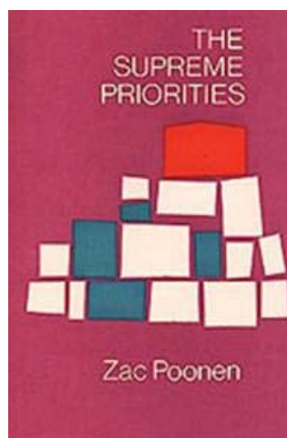
Das erste veröffentlichte Buch (1970) „Die höchsten Prioritäten“

Ich habe festgestellt, dass das Verfassen von christlichen Büchern kein Geld oder eine bequeme Umgebung oder sogar natürliche Fähigkeiten erfordert. Petrus und Johannes waren arme Fischer, keine Autoren. Und Paulus schrieb, während er in einem Gefängnis war. Aber sie alle strebten in ihrem Leben allein nach der Ehre Gottes, und Gott salbte sie mit dem Heiligen Geist. Sie schrieben darüber, was sie in ihrem Leben erfahren hatten – und keine leeren Theorien. Das war das Geheimnis. Und das ist der Grund, warum Gott ihre Schriften benutzt hat, um in den vergangenen 20 Jahrhunderten Millionen von Menschen überall auf der Welt zu segnen.